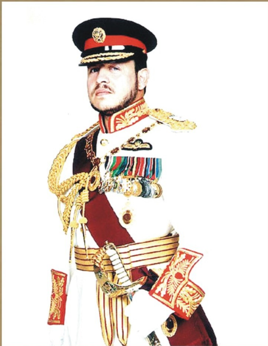
جلالة الملك عبدالله الثاني ابن الحسين المعظم