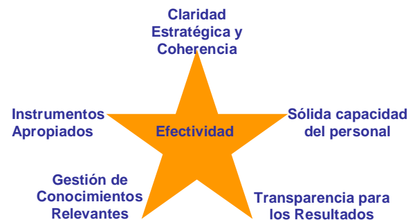
Fig. 2: Elementos Centrales para un Apoyo Efectivo

Las recientes revisiones de programas de agencias donantes, conducidas por miembros del consorcio del CGAP, concluyeron que se necesitaban cinco elementos centrales para mejorar la efectividad del apoyo a las microfinanzas a nivel de las agencias individuales. Estos elementos también contribuyen a determinar la ventaja comparativa de una agencia donante en su apoyo a los servicios financieros para los pobres.